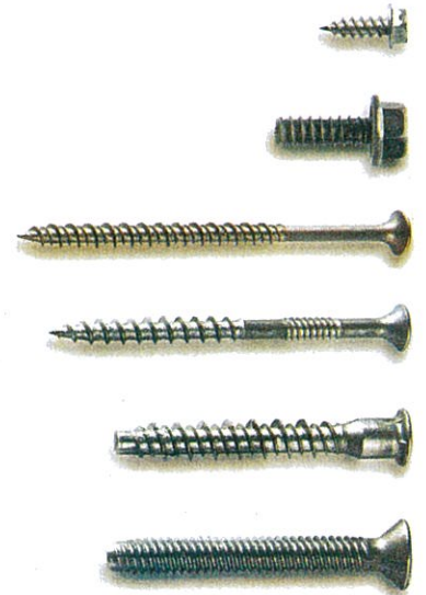
技術規範表 Technical data